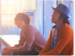
SE-NO 稚内出身兄弟デュオ