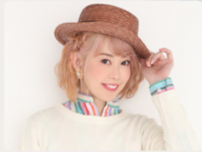
五條 真由美 プリキュアソングの歌姫