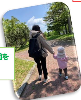
天北緑地公園をお散歩中