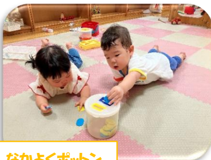
なかよくポットン