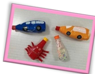
手作り広場「水てっぽう」