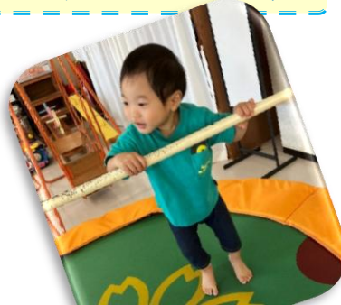
おもちゃライブラリーのトランポリン