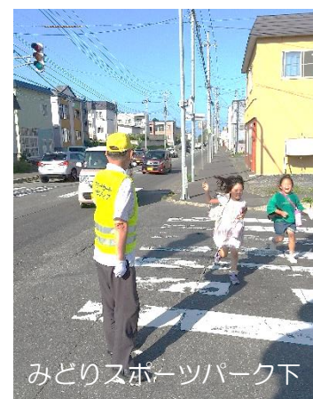
みどりスポーツパーク下

例年のない暑さの稚内市ですが、30℃近くまで気温が上昇した8月21日(木)街頭で子どもたちを見守るスクールガードさんたちです!