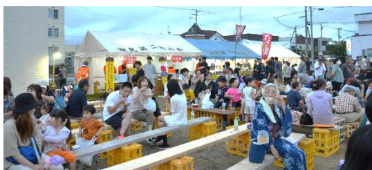
たくさんの方が楽しんだ潮見会場