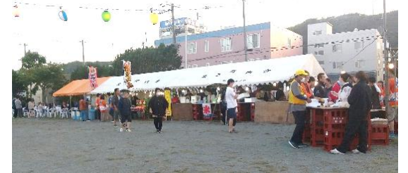
露店も出店し賑わった中央の盆踊り