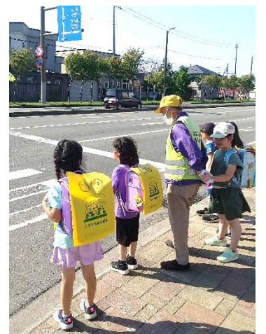
給食センター交差点