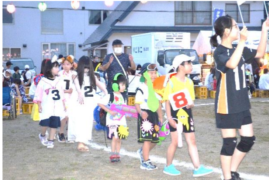
潮見町内会の子も仮装盆踊り