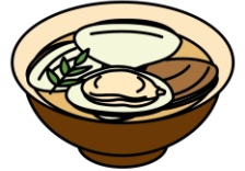
はまぐりのお吸い物

3月3日は「ひな祭り」。女の子の健やかな成長を願ってお祝いをする日本の伝統行事です。現在のように、ひな人形を飾るようになったのは江戸時代のことで、もとは人形を身代わりにして邪気をはらう「流しびな」が起源とされます。行事食として、ちらしずし、はまぐりのお吸い物、ひしもち、ひなあられなど、華やかな食べ物が並びます。